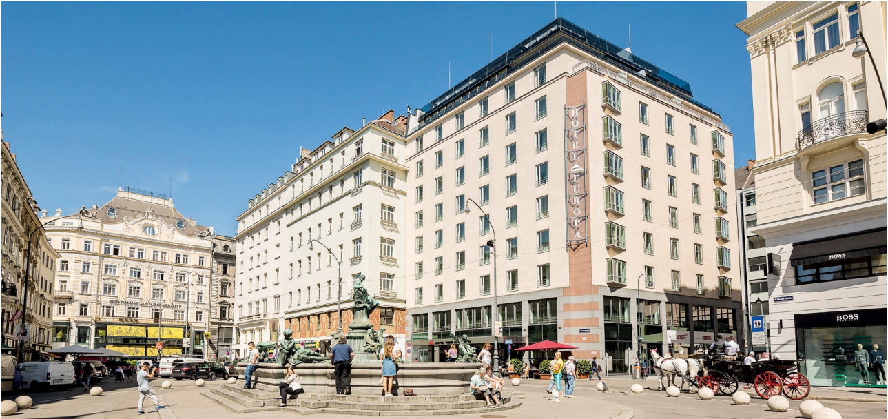
Das Hotel Europa am Neuen Markt 3 in Wien wurde um eine Ebene aufgestockt.