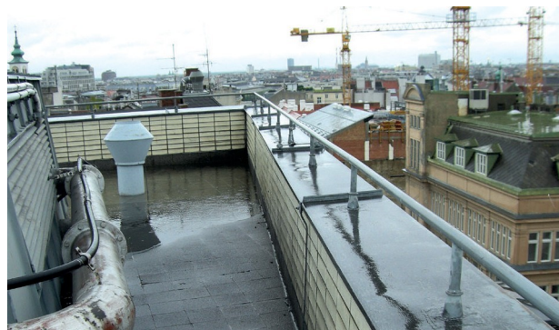
Der vorhandene Dachstuhl wurde abgebaut.